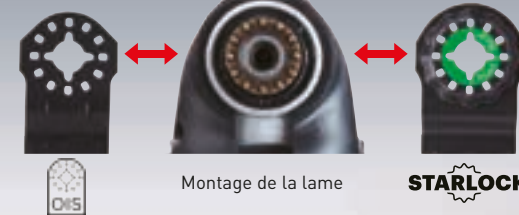
Montage de la lame

Le support accepte les lames de types OIS et Starlock.