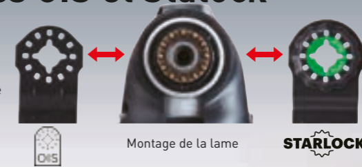
Montage de la lame

Le support accepte les lames de types OIS et Starlock.